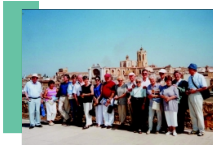
Die FITCE-Reisegruppe vor der Kathedrale von Tarragona

Zwischen Poblet und Santa Creu hatten wir noch einen Zwischenstop